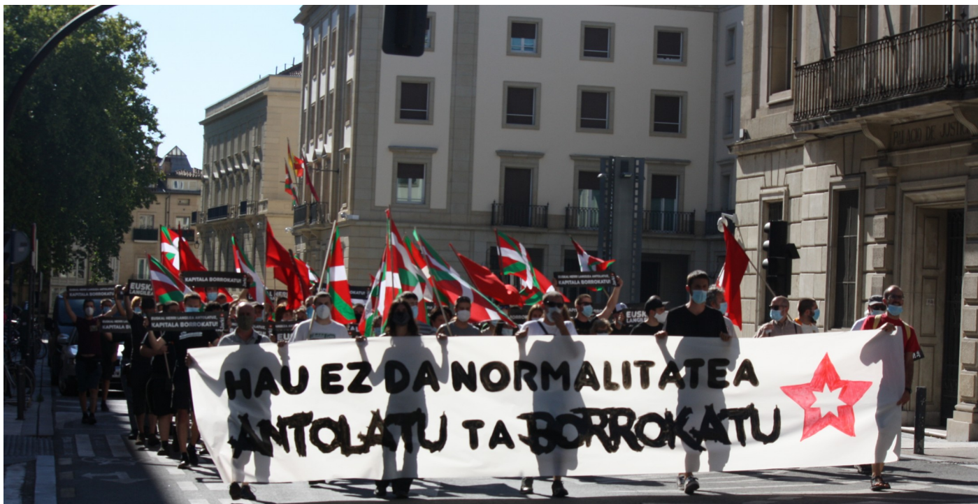
·2020ko uztailaren 18ko manifestazioa, Gasteiz

iraultzailearen subjektua izan behar den Euskal Langileri Iraultzailearen teorizazioa jasotzen zuen ponentzia onartu zituen. Aipagarria da, militantzia kritikoak Euskal Herriko Mahaian jokaturako papera, egituretatik era ofizialean aurkeztutako hiru ponentzietatik bat alboratu baitzuen. Lan ildoa zehazten zuen ponentzia hainbat emendakinekin onartua izan zen eta ildo ideologikoaren zehaztapena inplikatzeko ponentzia, berriz, atzera bota eta militante talde batek aurkeztutako kontraponentzia onartu zuen militantziak gehiengo zabal batekin.