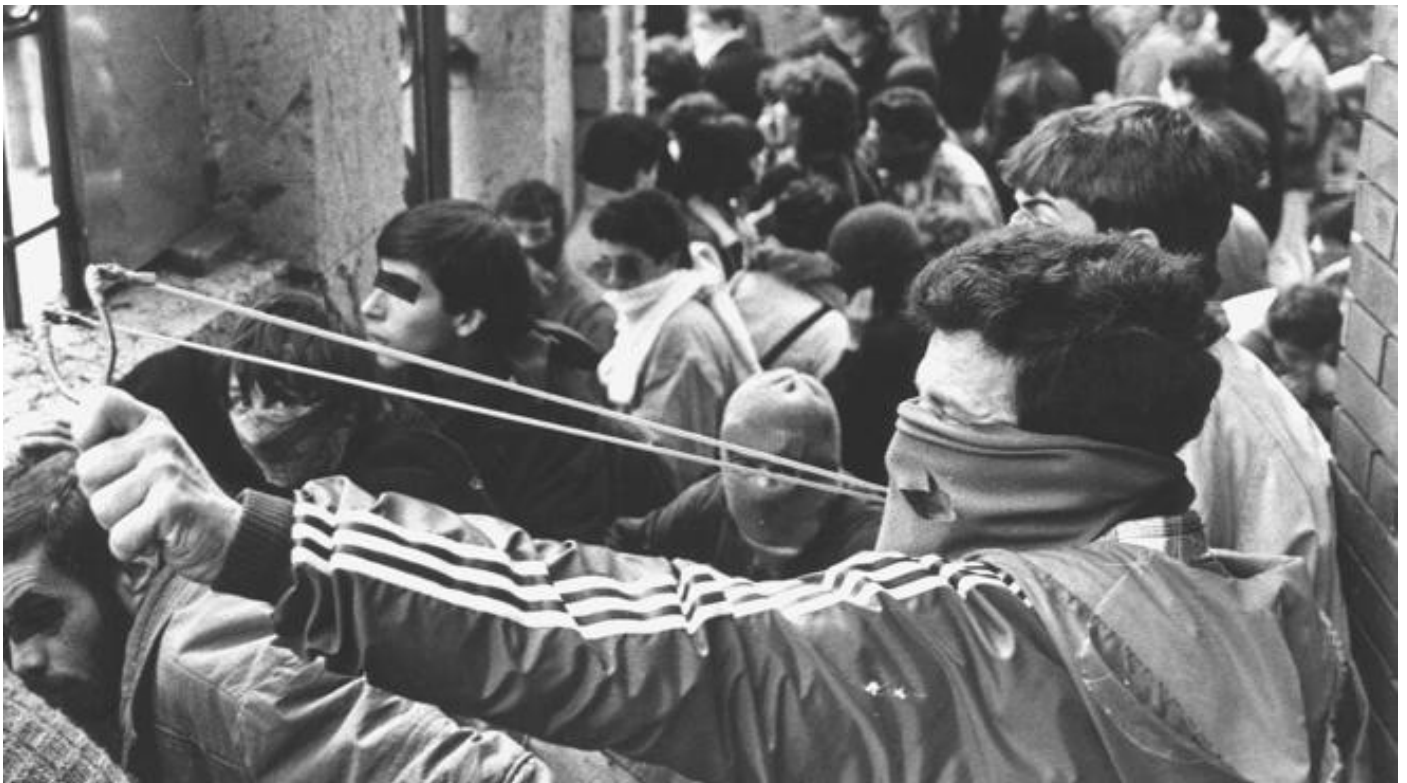
·1984 Euskaldunako greba, Bilbo

Jada laburki aipatu den moduan, alde batetik gremio edo ekoizpen adarreko izaera duten sindikatuak aurki ditzakegu: irakasleen sindikatuak, erizainen sindikatuak... Bestetik, sindikatu orokorrak edo unitarioak kokatzen dira, esparru geografiko zehatz batean (estatala, nazionala, kontinentala...) lan esparru ezberdinak barnebiltzen dituen.