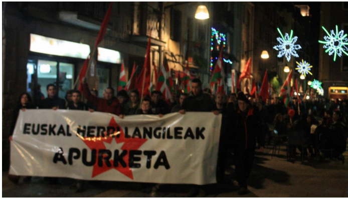
·2019ko abenduaren 6ko manifestazioa, Durango

eta onartu zen, kide guztiak aurremilitantzia prozesua burutu behar zutenaren adostasunera iritsi zelarik. Horrela, kideen formakuntza bermatzearekin batera, materialaren egokitasuna frogatu eta beharrezko moldaketak burutzea ahalbidetu zen. Era berean, sortze batzarrean adostutako ildo estrategikoari zegozkion zenbait gabezia suspertu ziren, ildoaren beraren zehaztapena burutu zelarik. Betiere, argi izanda ildo estrategikoaren helburu nagusia hau bukatzerakoan alternatiba iraultzailea osatu ahal izateko baldintzak ezartzea zela.