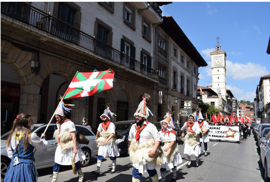
-Aberri Eguna, Gernika

martxan jartzen ari den eta landuko dituen izaera sektorialeko ekimenak ezagutzera eman, eta hauen nondik norako eta abiaraztearen zergatia azaldu ziren.