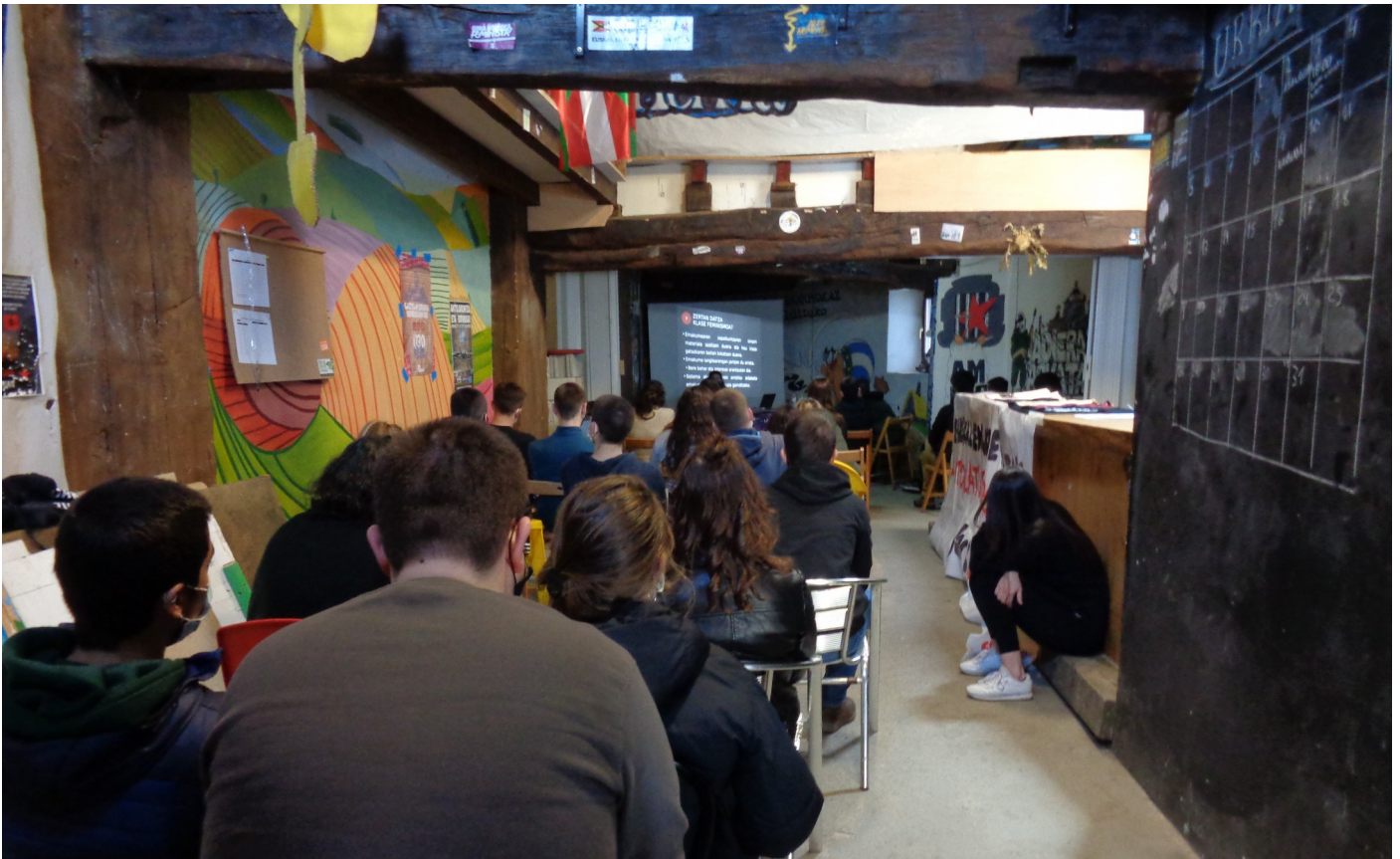
·Klase feminismoaren hitzaldia, Iturmendi

garapenari dagokionez, gazi-goza izan da. Alde batetik, hitzaldiei dagokien asistentzia maila ez da izan antolakundeak aurreikusitakoa, bi hitzaldi desertu gisa geratzean gauzatu ezin izan zirelarik. Honek ez du esan nahi gainerako hitzaldietako asistentzia urria izan denik, baina hala ere, sozializatzerako orduan eta jendearengana ailegatzeko orduan oraindik ere aurretik lan handia dagoenaren zantzua da. Bestetik, balorazio positiboa egiten da hilabetean zehar bi egunik behin hitzaldi bat burutzea lortu den heinean eta baita Emakumeen Egiturako kideek burututako lanketa politikoari dagokionez, bere lehen hitzaldi eta jardun publikoari ekin baitiote, antolakundearen oinarri ideologikoak zabalduz eta hauek era egoki, garbi eta pedagogikoan plazaratuz.