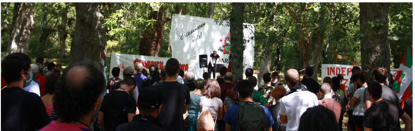
·2020ko Albertia Eguna, Legutio

Hala ere, koordinadoraren lehenengo hastapenak ez dira samurrak izan. Mugikortasun murrizketek eta pandemiak sorrarazitako egoeran, Eusko Ekintzak, gainerako kideak informatu gabe eta urritik koordinazio markoetara bertaratu barik, 2021eko otsailean bere parte hartzea izoztuta uzten zuela egin zuen publiko bere sare sozialen bitartez. Aipatu beharra dago, bai Askatasun Haizeak, Bultza Herri Ekimenak zein JARKI antolakunde iraultzaileak sare sozialen bitartez izan zutela erabaki honen berri. Dena dela, urritik agertu gabe egon ondoren, eragile lokalek eta JARKI-k Eusko Ekintza koordinadoratik kanporatzeko erabakia hartua zuten, hauek informatu ondoren publiko egiteko asmoa zegoelarik. Izan ere, JARDUN-eko erabakiak antolakunde guztiengatik partekatuak eta eztabaidatuak izan behar zirenez gero, urritik koordinadora blokeatuta zegoen.