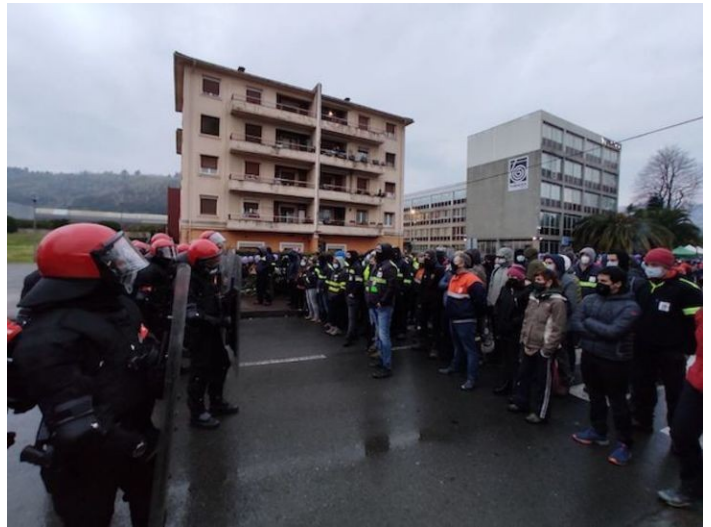
·2021 Tubacex-eko greba, Aiaraldea

sindikatuaren praktikan zehar, beste eragile ekonomiko eta politikoen aurrean izaera nagusi bat ezarri sindikatuari.