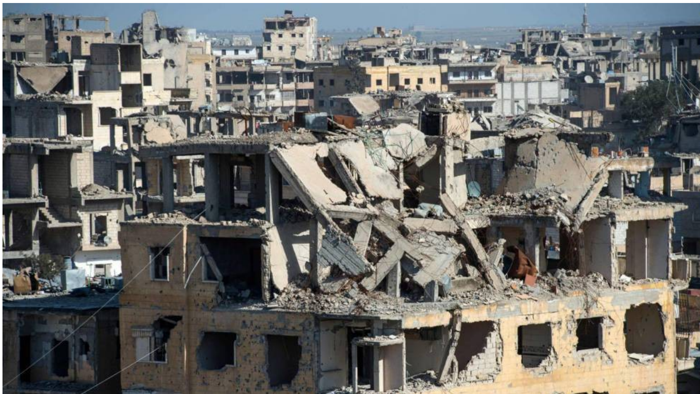
·Siriako gerrako ondorioen irudia, Damasco

“Nahiz eta delako herrialdearen politiketikiko barne kritikak gauzatzea zilegi eta beharrezkoa den, burutu beharreko aldaketak bertako herri langile kontzientearen baitatik bakarrik jaito daitezke, bertako elementuen arteko klase gatazkan.”