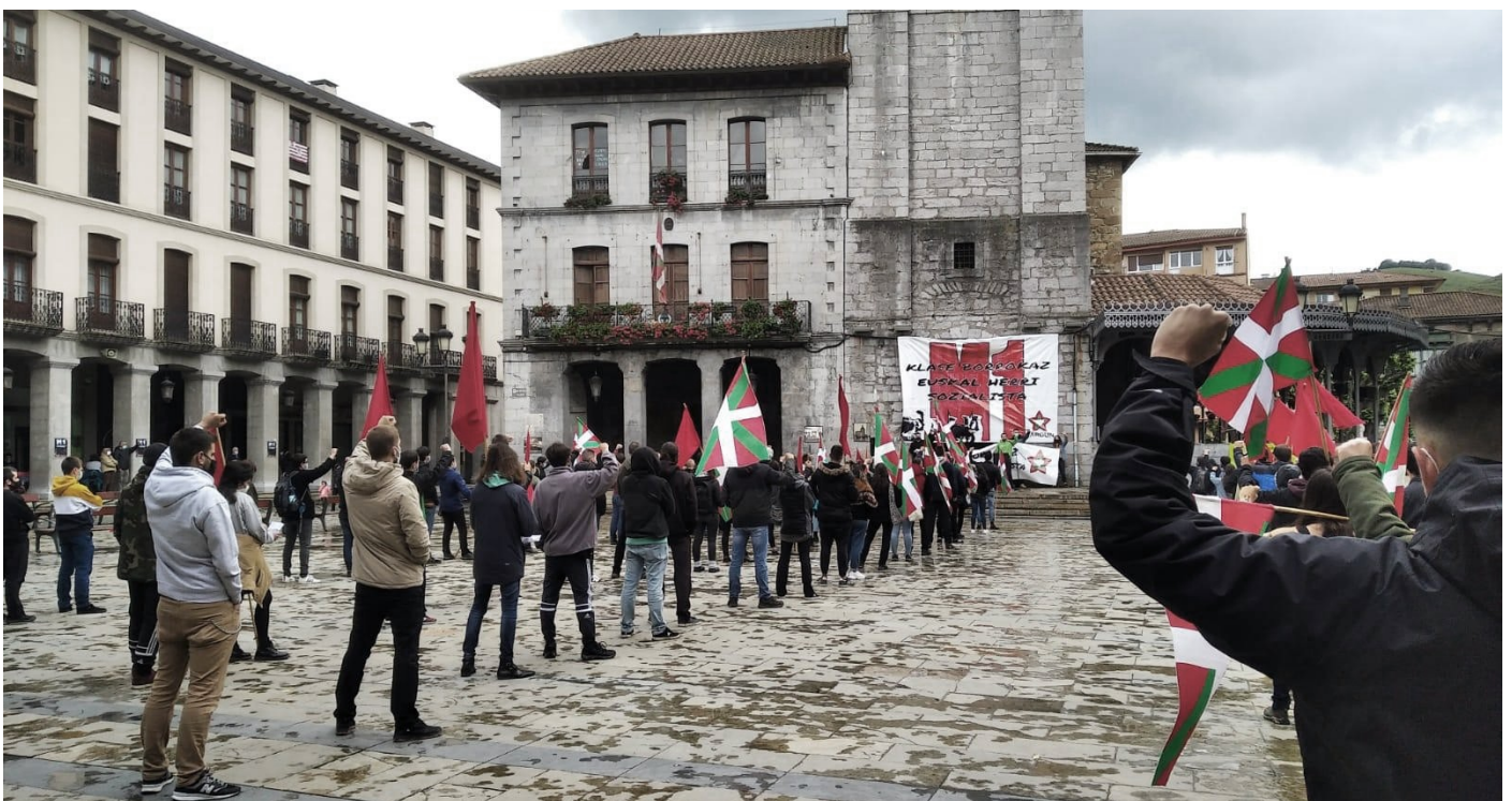
·Maiatzaren Lehena, Laudio

Gauzak horrela, 150 bat pertsona bildu ziren JARDUN koordinadorak Laudion deitutako manifestazioan. Hau Herriko Plazatik hasi zen, Laudioko kaleetan barrena herriari buelta eman eta berriz ere hasierako puntuan bukatu zen, aipagarriak diren titulu edota gertakariak gauzatu gabe. Behin plazan, koordinadorako kide batek batasunean eta antolakuntzan enfasi berezia egiten zuen hitzaldia bota zuen, Maiatzaren Lehena Euskal Herrian izaera folkloriko edota desfileetara mugatutako eguna izateaz haratago, prozesu iraultzailearen baitako beste borroka egun bat lege kokatzearen beharra aipatuz. Ea berean, JARDUN-en parte hartu eta bertan antolatze deia luzatu zien bai bertakoei zein Euskal Herriko langileei.