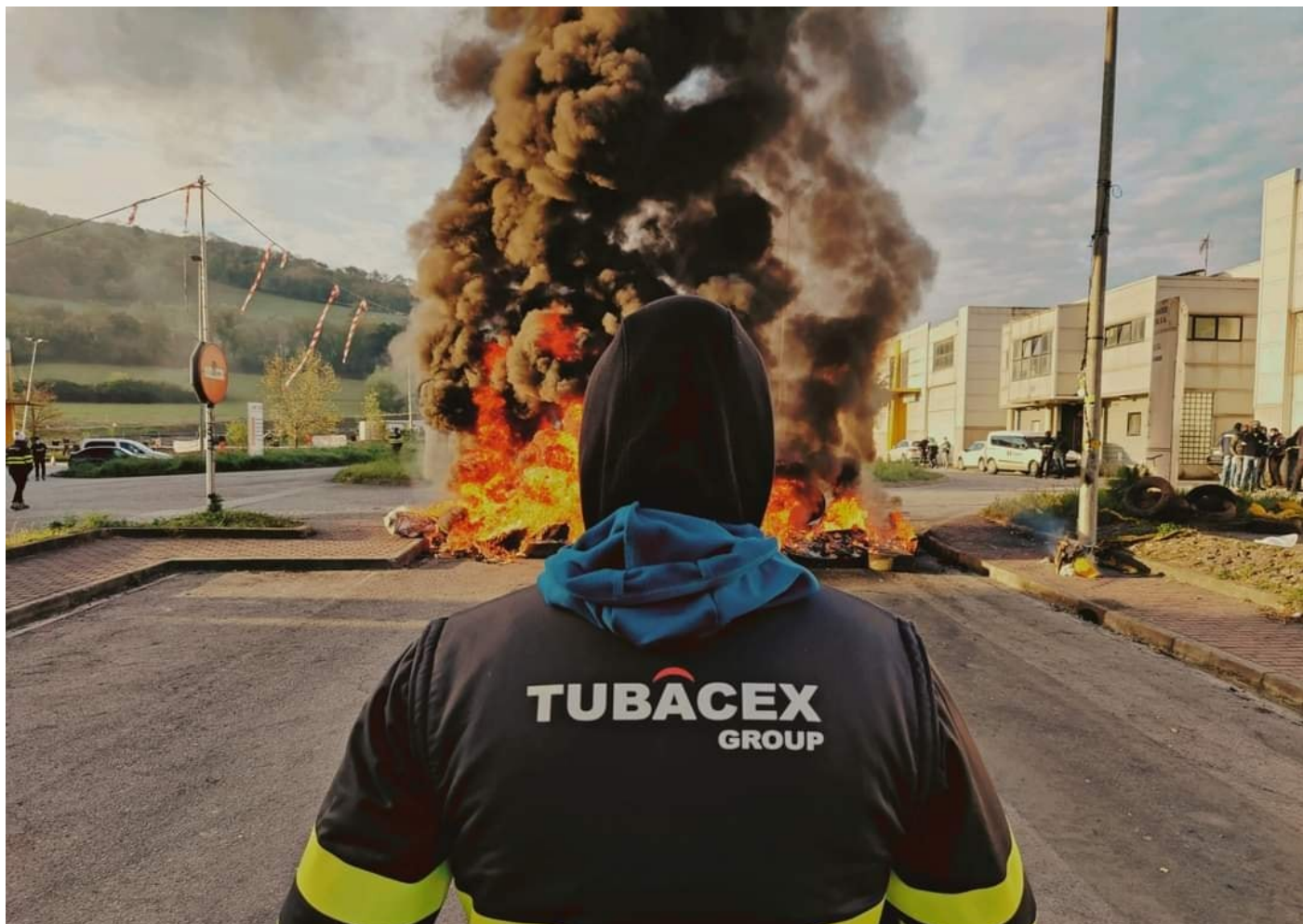
·2021 Tubacex-eko greba, Aiaraldea

Honakoa une honetan greba mugagabeen aurkitzen den Tubacex-eko behargin bati egindako elkarrizketa dugu.